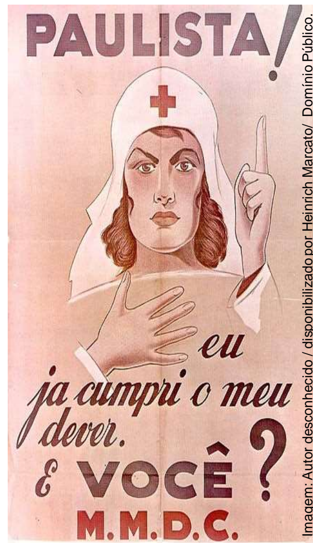
Cartaz convocando as mulheres paulistas para a revolução de 1932