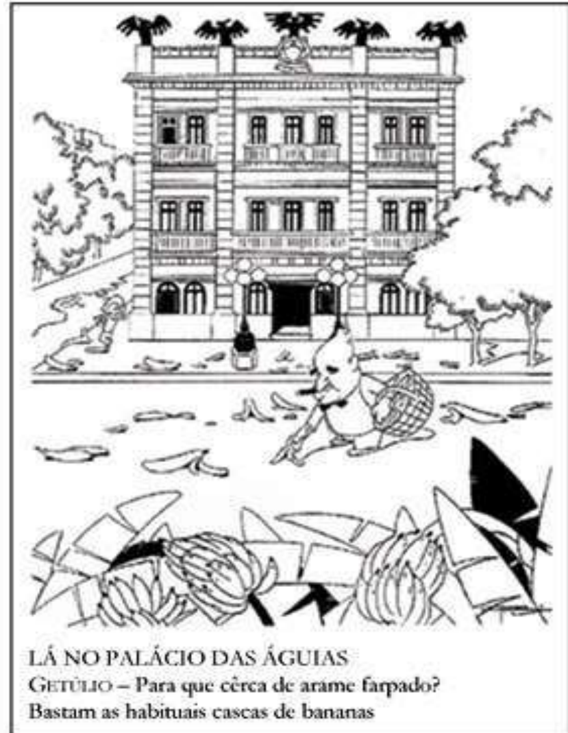
FIG. 6 - "Lá no Palácio das Águias". Careta. Rio de Janeiro, 30/01/1937.