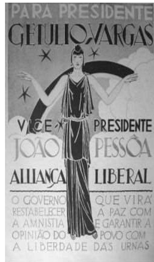
Cartaz de campanha de Getúlio Vargas para Presidente da República na eleição de 1930.