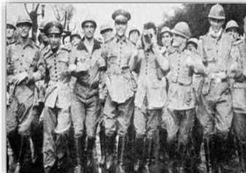
INTENTONA EM RECIFE.