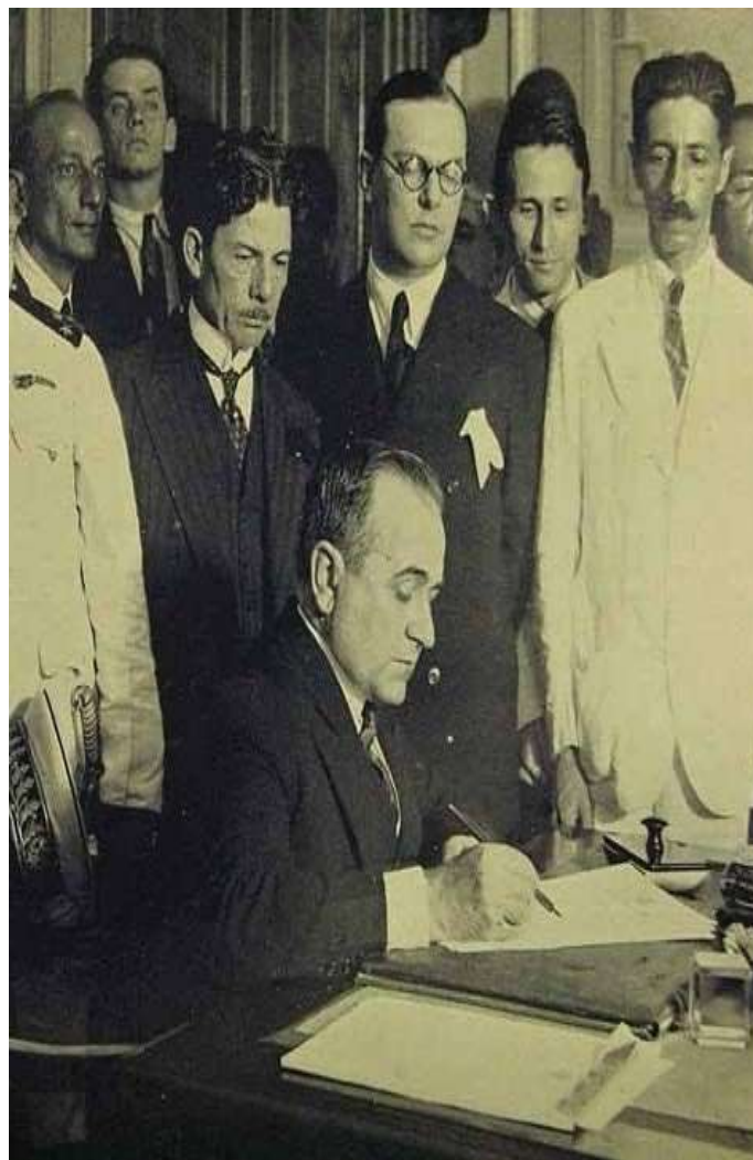
Getúlio Vargas nomeando os Ministros, em 03 de novembro de 1930.