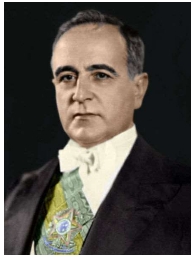
Getúlio Vargas da Presidência da República Federativa do Brasil.

Para compreender esse período da História do Brasil, vamos começar com o período de 1930-1937.